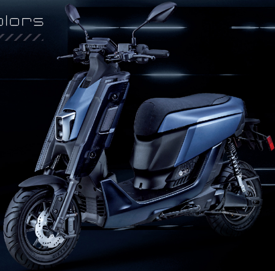
寂光藍 / 藍深灰 / G09BQ1