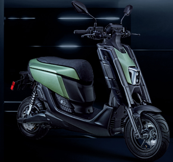
蒼邃綠 / 綠深灰 / G09AR1