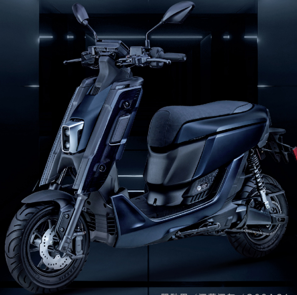
闇馳黑 / 深藍深灰 / G09AC1