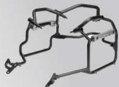
鋁側箱支架 | NT$.13,500