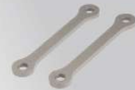
降座高套件 | NT$.3,900