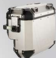
鋁側箱(右)37L | NT$.16,500