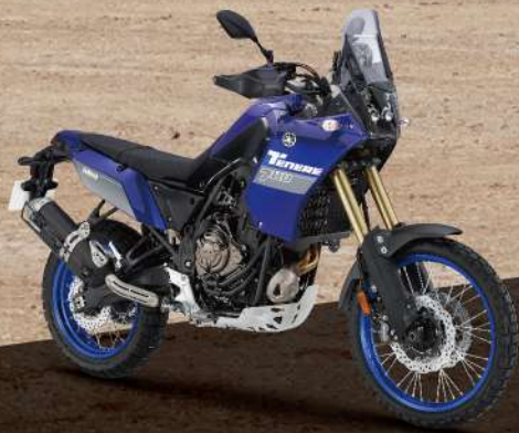
Icon Blue 藍深灰 176BQ2