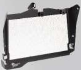
水箱護網 | NT$.4,700