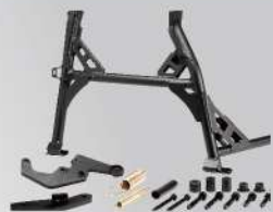
中柱 | NT$.11,000