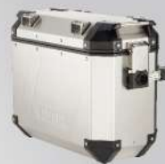
鋁側箱(左)35L | NT$.16,500