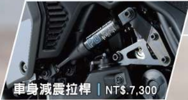
車身減震拉桿 | NT$.7,300