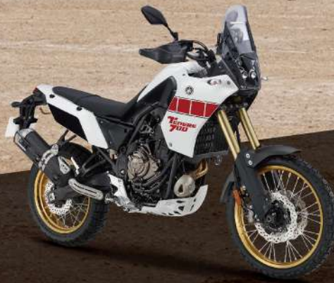
Classic White 白紅 176121