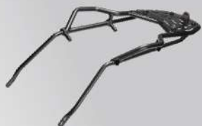
後架總成 | NT$.10,500