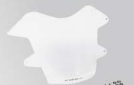
頭燈護罩 | NT$.4,100