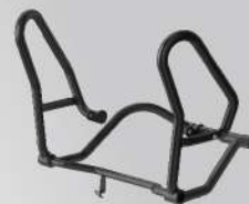
引擎保桿 | NT$.10,000