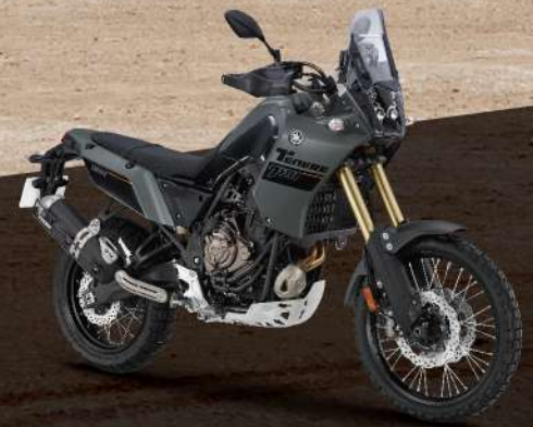
Tech Kamo 深灰 176451