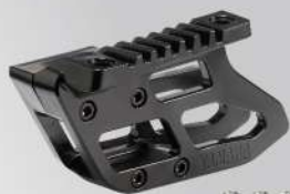
導鏈器 | NT$.31,000