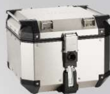
鋁後箱42L | NT$.16,000