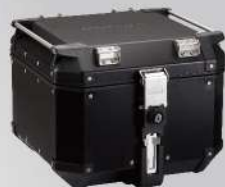
黑色鋁後箱42L | NT$.16,000