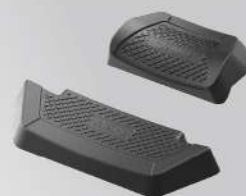
鋁後箱靠墊 | NT$.2,500