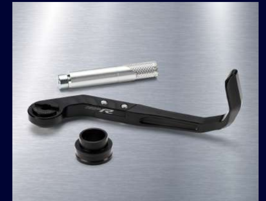
煞車拉桿護弓 BEB-FFBRP-00 建議售價：NT$ 5,900