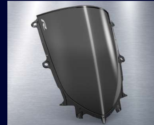
燻黑風鏡 BEB-261C0-00 建議售價：NT$ 2,300