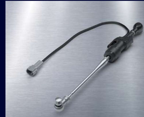
快排套件組 BEB-181A0-00 建議售價：NT$ 5,000