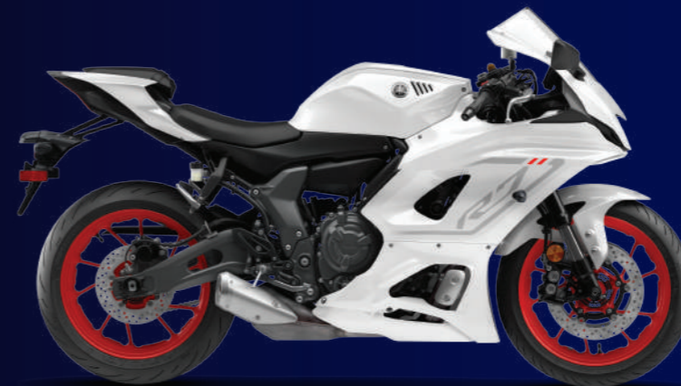
Intensity White 極致白(白) I74052