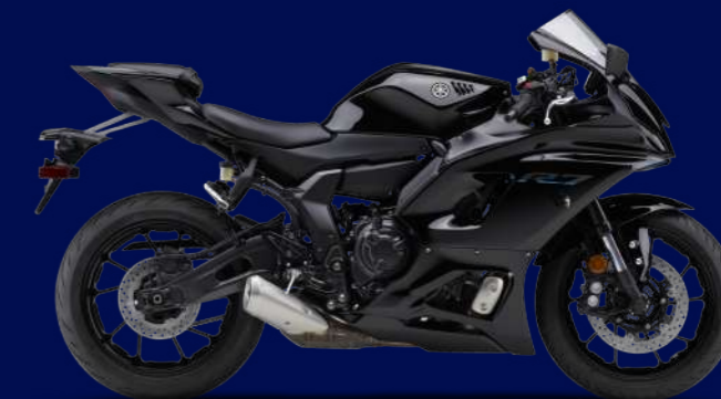
Performance Black 性能黑(黑) I74063