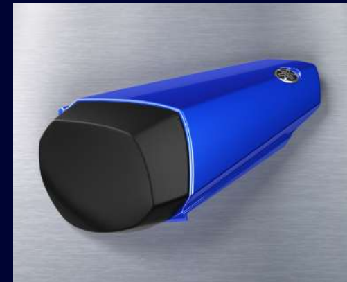
單人坐墊蓋 藍色：BEB-247F0-01 黑色：BEB-247F0-A0 60周年配色：BEB-247F0-B0 建議售價：NT$ 5,300