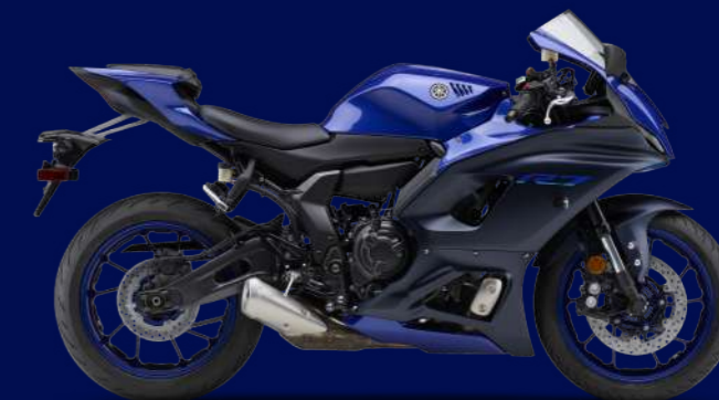
Team Yamaha Blue 競技藍(藍深灰/消光) I74BQ3