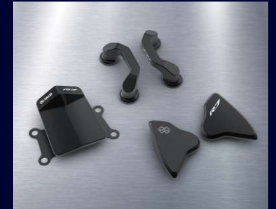
競技飾蓋組 BEB-FRCVK-00 建議售價：NT$ 9,800