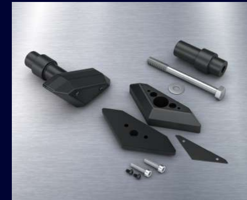
防倒滑塊 BEB-F11D0-V0 建議售價：NT$ 11,000